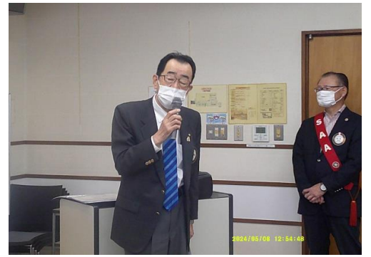
プログラム委員長の講師紹介