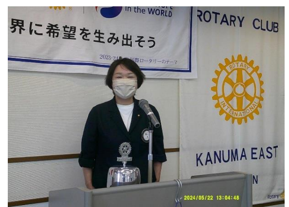
横川会員による説明