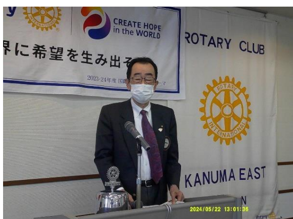
プログラム委員長による紹介