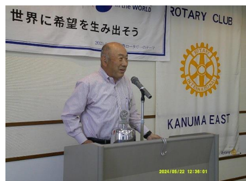
納会コンペよろしく!