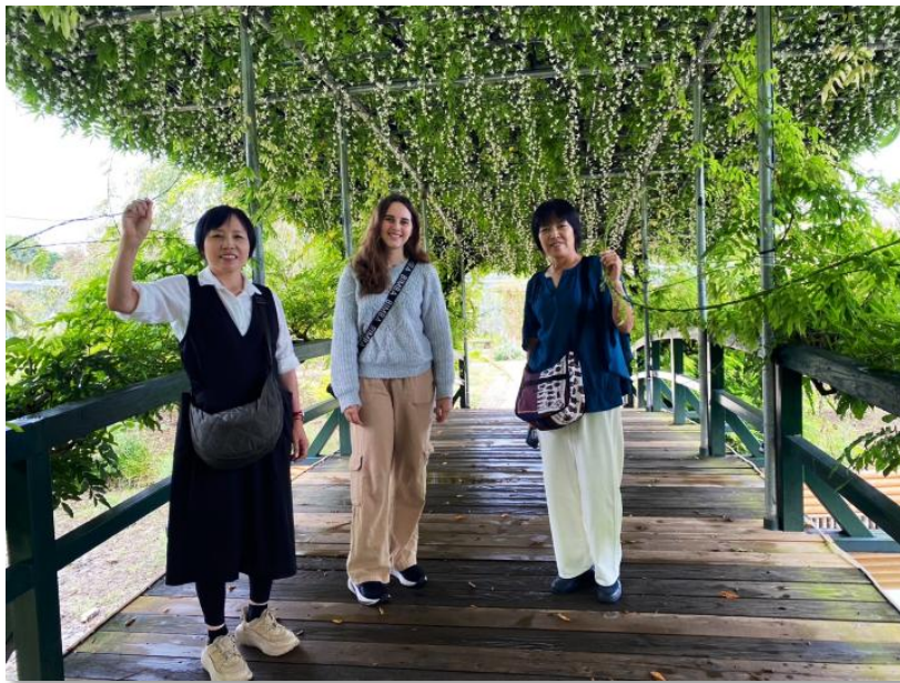
足利フラワーパークにて